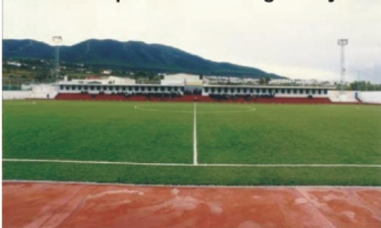
Actual campo de fútbol Miguel Fijones

De este millón y medio de euros, la Junta de Andalucía aportó según un convenio firmado hace un par de años, 400.000 euros y ahora hemos aprobado este nuevo convenio según el cual la institución autonómica subvenciona en los próximos cuatro años 142.000 euros, aunque el Ayuntamiento dispone de toda la financiación para empezar las obras en cuanto se aprueben los proyectos, con los cual todos estos equipamientos podrían quedar terminados a finales del año 2009".