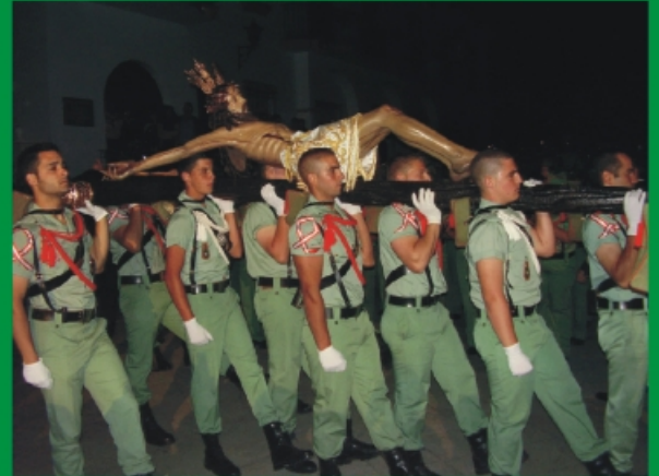
La Pepa portando a hombros a nuestro Cristo.

El día 2 de mayo amaneció expectante y alegre para recibir a la Pepa y a la banda de la Santa Vera-Cruz en su diana. Por la tarde, entrada de las bandas y visita a la Parroquia y a la ermita de San Sebastián para terminar en la ermita del Convento.