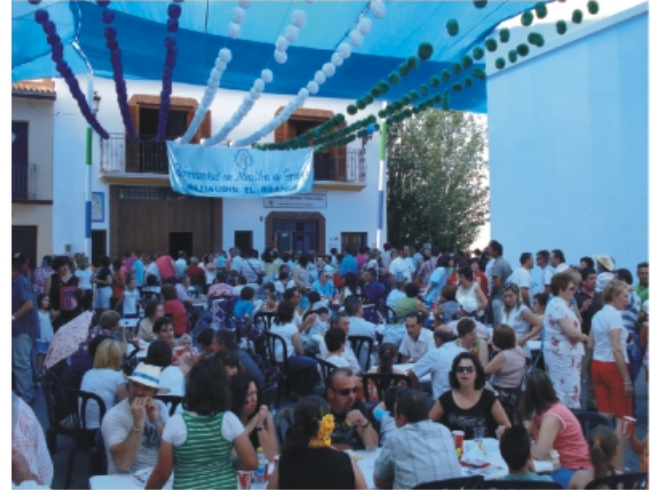
Chiringuito Virgen de Gracia Feria de día.