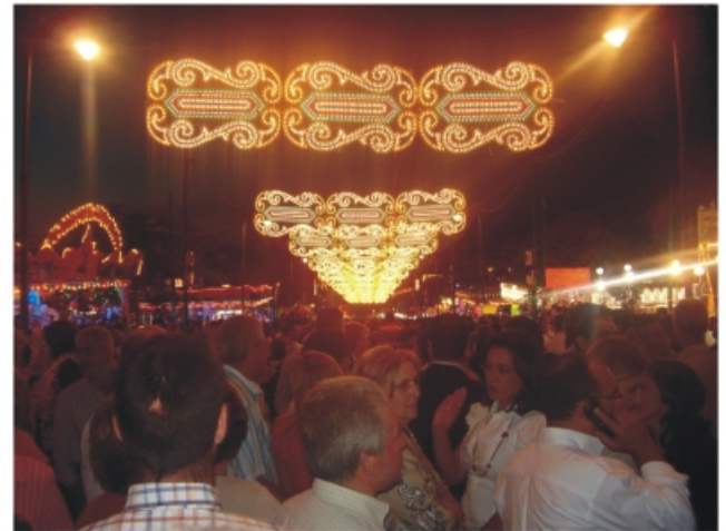
Feria de noche. Recinto Alcalde Antonio Solano.