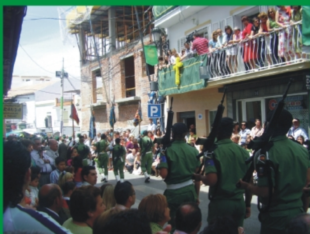
Brigada Paracaidista en el desfile del 3 de mayo.