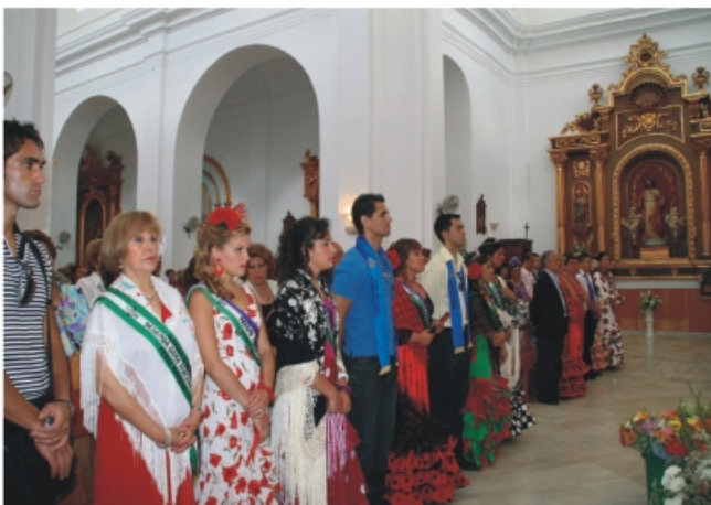
Misa rociera en honor a nuestra Señora de Gracia.