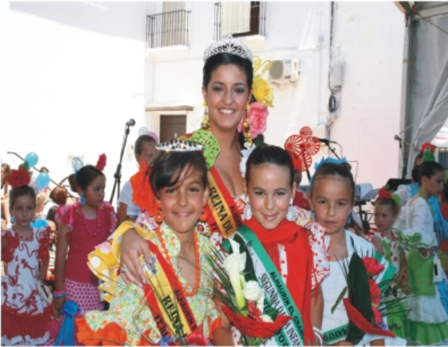
La Reina de la Feria 2008 con la reina infantil y su corte de honor.