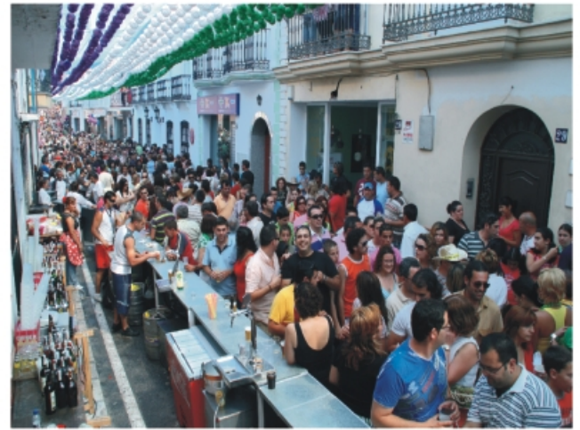
Barra del Moto Club Alhaurino. Feria de día.