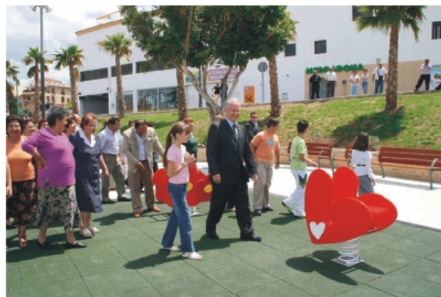
Parque El Palomar