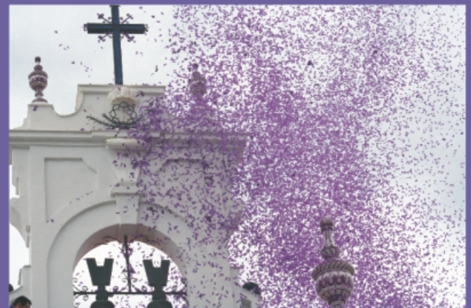
Papelillos morados sobre la espadaña de San Sebastián.

Y es que, no en vano, la Hermandad posee una gran tradición musical que se refleja año tras año en la participación en sus Fiestas de las más prestigiosas formaciones musicales andaluzas, tales como la Agrupación Santa María Magdalena de Arahal, la Banda de Música "Maestro Tejera" de Sevilla, la Banda de Música de la Cruz Roja de Sevilla y la de Antiguos Alumnos del Colegio de Huérfanos de la Guardia Civil de Cádiz ("Polillas"), magníficas agrupaciones que se dignaron a acompañarnos. A ellas debemos añadir las dos Bandas de Cornetas y Tambores de la propia Hermandad, creadas en 1979 y 1996, así como nuestra Banda de Música, nacida en 1997.