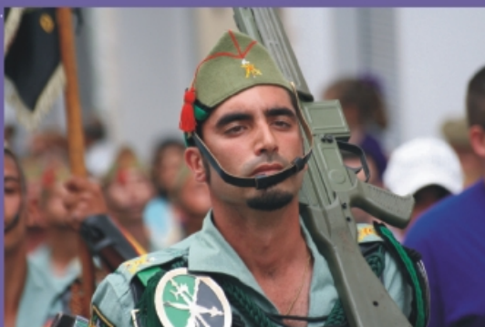
Primer Plano Soldado Tercio Legión.