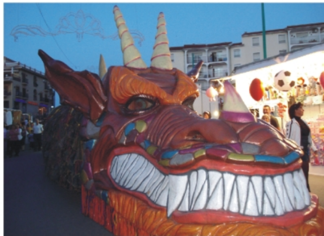
Este dragón participó en el pasacalles inaugural.