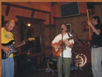
Grupo Local El Cirguero y La Bandá

24 julio Devil's Dandruff 21 agosto Sonrisa del Caimán