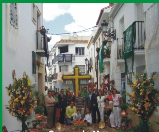
Cruces de Mayo.

Expresar con palabras el Día de la Cruz es tarea difícil. Hemos intentado resumir lo que hemos vivido este año pero lo mejor lo llevamos dentro de nosotros mismos y esos sentimientos es imposible encerrarlos en unas palabras. Por eso le pedimos al Señor del Convento salud para vivir otro Día de la Cruz y volver a sentir lo que ya hemos sentido; para vivir lo vivido.