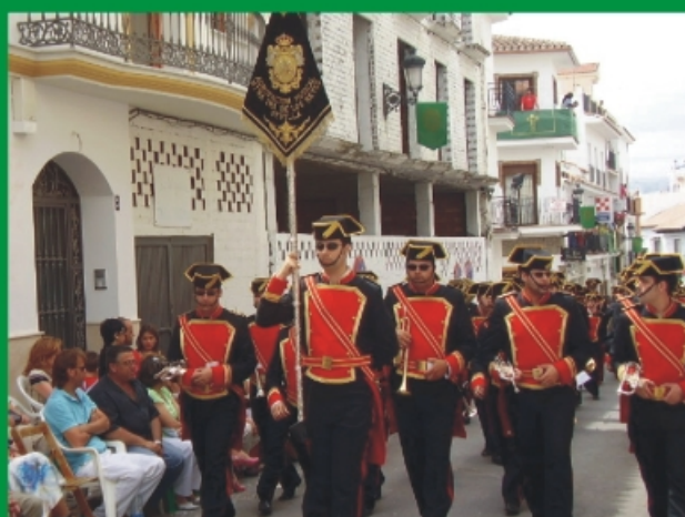
Agrupación Musical Nuestra Señora de los Reyes (Sevilla)

Esta gratitud se manifiesta en la Misa de Acción de Gracias celebrada el fin de semana siguiente al Día de la Cruz y que este año ha tenido como complemento, nuestro agradecimiento hacia aquellas personas que había hecho una cruz, participando en el 1er. Certamen de Cruces de Mayo y que ha sido todo un éxito.