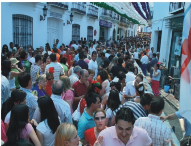
Feria del Centro. Calle San Sebastián.