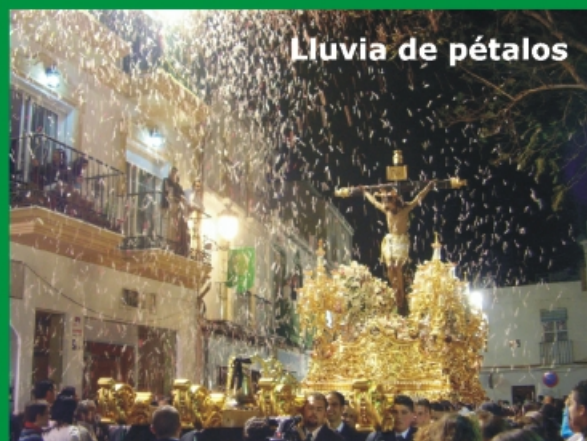
Lluvia de pétalos

Comienza la Procesión y los Hermanos de la Santa Vera-Cruz sentimos por un lado, el deseo de ver de nuevo al Señor en su ermita y por otro la pena porque otro Día de la Cruz termina. La Procesión perfectamente organizada, los cirios, las mantillas, nuestra hermosa Cruz guía que abre el cortejo, el Señor que lo cierra y en medio, nuestra Cofradía.