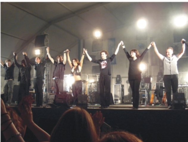
Malú en el concierto de sábado.