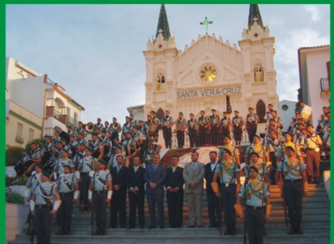
Banda Santa Vera-Cruz en su X Aniversario.

El día 2 de mayo amaneció expectante y alegre para recibir a la Pepa y a la banda de la Santa Vera-Cruz en su diana. Por la tarde, entrada de las bandas y visita a la Parroquia y a la ermita de San Sebastián para terminar en la ermita del Convento.