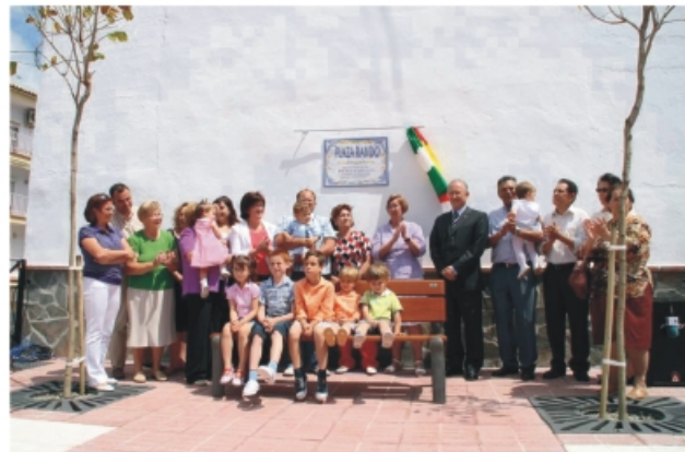
Plaza de Rando

Una jornada repleta de inauguraciones de nuevos espacios públicos, distantes y de reducidas dimensiones. Con la apertura de la Plaza Rando se ha mejorado el acceso a la zona de la Plaza del Juzgado y Edificio de Asuntos Sociales, y, además, se facilita el tránsito peatonal en una de las zonas comerciales más concurridas del municipio.