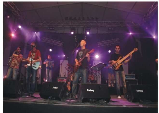
Actuación de Celtas Cortos en la Caseta Oficial.