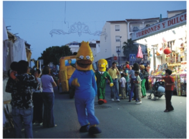
Los Simpsons también recorrieron las calles alhaurinas.