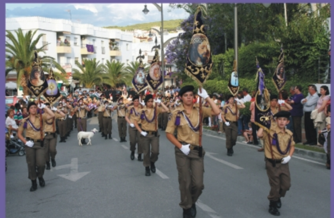
Banda de Cornetas y Tambores.