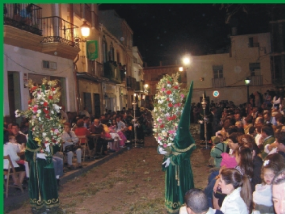
Nazarenos portando los tradicionales cirios.

¡Día de la Cruz, 3 de mayo! Fiesta local porque es un día grande, el verde es protagonista y el Señor del Convento nos reúne en una solemne eucaristía en la parroquia.