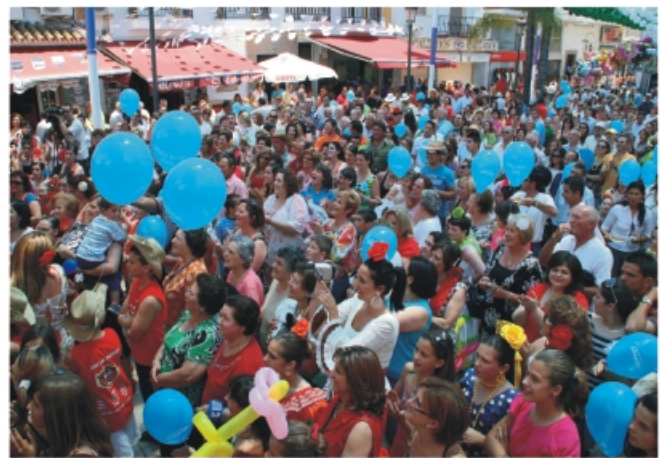
Feria del Centro. Plaza Baja.