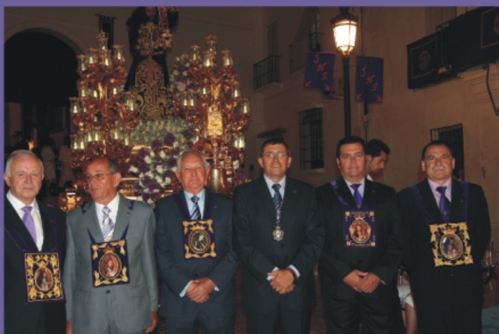
Antiguos Hermanos Mayores delante del trono de Jesús.

Junto a ellas, también figuraron en el cortejo una representación de la malacitana Hermandad de la Estrella, con la que se han restablecido el presente año los tradicionales vínculos que nos unieron en el pasado, la venerable reliquia del Santo Lignum Crucis , y las de San Roque y Santo Domingo de Guzmán, concedidas expresamente a nuestra Hermandad por la Santa Sede.