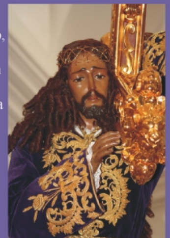
Nuestro Padre Jesús.

Más tarde, los tradicionales actos. El desfile, el almuerzo, el Concierto, la Retreta, y, posteriormente, la procesión de vuelta a San Sebastián. Todo hasta que, pasada la una de la madrugada del lunes “Padre Jesús” volvía a San Sebastián a los sonos del Himno nacional tras una vista de fuegos Artificiales.