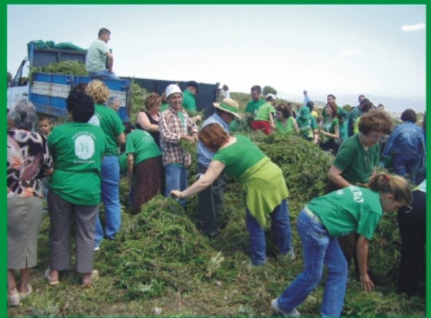
Recogida del Romero.

El día 1 de mayo nuestros campos estaban aún mas verdes porque miles de Hermanos de Arriba trabajaban y disfrutaban recogiendo el romero que alfombraría las calles para el Señor del Convento. Una perfecta organización que hizo que nuevamente viviéramos un día de romero esplendoroso.