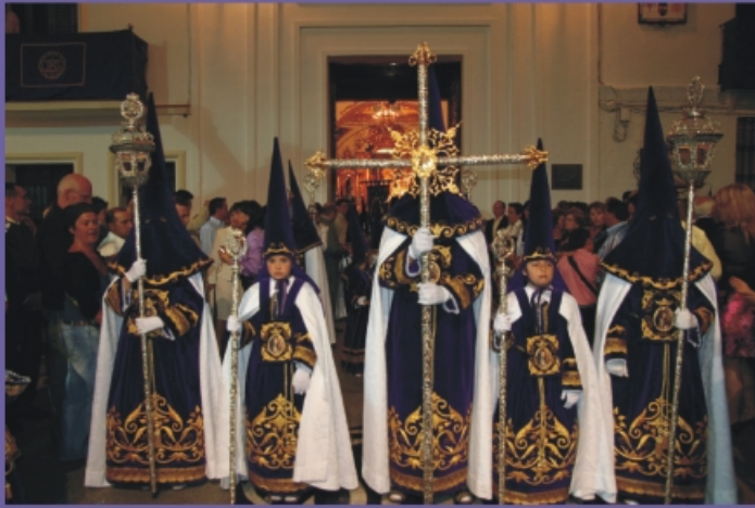
Cruz Guía de la Hermandad.

Y, como marca la tradición, Nuestro Padre Jesús Nazareno fue llevado en procesión hasta la Iglesia a hombros de sus hermanos, que le vitorearon y cantaron su Himno. Acompañando a nuestro Sagrado Titular, cientos de nazarenos portaron los magníficos enseres de la Hermandad, entre los que se encuentran sus ricas túnicas de terciopelo bordadas en oro, estandartes, bocinas, báculos, mazas, cruces de procesión y los tradicionales “cirios”.