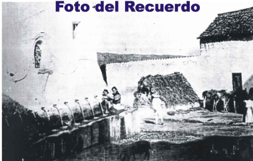
Fuente Lucena, año 1884