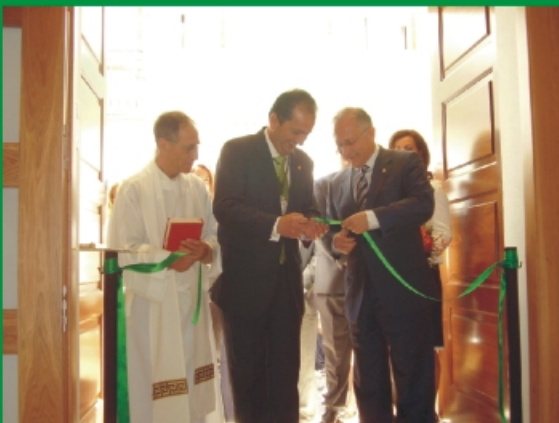
Inauguración Nueva Casa Hermandad.

Miro hacia atrás y el recuerdo del pasado Día de la Cruz hace que me llene de orgullo hacia mi Cofradía. Orgullo basado no sólo en la grandeza de los cultos y actos realizados, sino que también me enorgullece el modo y las formas que mi Cofradía pone a la hora de hacerlos: Alhaurín engalanado; balcones con paños verdes y cruces de flores. Las casas de mis hermanos se engalanan para esperar y disfrutar de nuestros días grandes. Expresión cofrade que nace en el corazón de los hogares de mis hermanos y llega hasta las fachadas de sus casas. La fe va de dentro hacia afuera, libre, espontánea, sin compromisos. Son oraciones de familias que quieren manifestar que se sienten Hermanos de Arriba.