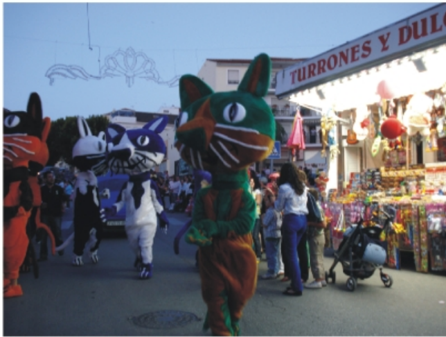
Cabalgata de gigantes y cabezudos a la entrada del recinto ferial.

Alhaurín el Grande se engalanó un año más para celebrar su feria 2008, un acontecimiento que se consolida como una de las citas imprescindibles del calendario cultural y de ocio de la provincia de Málaga convirtiéndose en referente por su especial atractivo y colorido, pero sobre todo por la hospitalidad y simpatía de los alhaurinos.