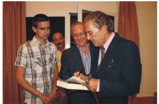
Antonio Gala firmó nuestra revista

Sin duda nos encontramos ante uno de los andaluces más geniales de nuestra historia contemporánea. Licenciado en Derecho, en Filosofía y Letras, en Ciencias Políticas y en Económicas, Antonio Gala es ante todo, un hombre de palabras. Así, lo testifica su más de medio centenar de obras publicadas y, por supuesto, su oratoria, su dominio del lenguaje en todo su continente y contenido, su discurso siempre lleno de ingenio y saber. Ha cultivado todos los géneros literarios: la novela, el teatro, la opinión, la poesía... aunque, sin duda, ha sido el teatro el género mediante el cual se consolidó como uno de los elegidos.